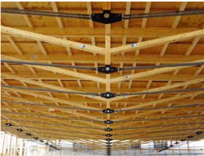
広島県福山市のスーパーマーケットで採用された ATAハイブリッドトラス