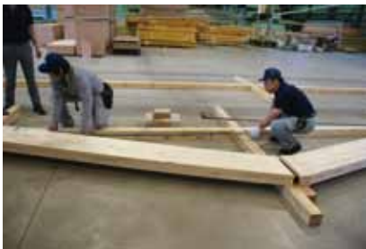
① ターンバックルを回して締める