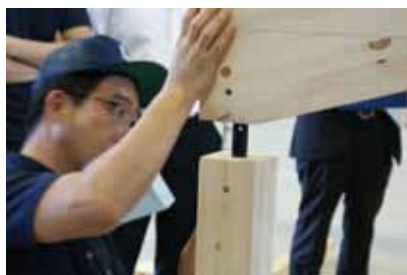
⑤ 柱のほぞパイプに落とし込む