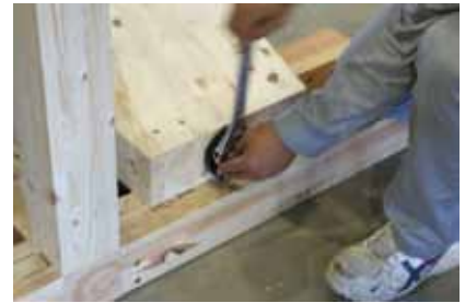
③ 耐圧プレートを締める