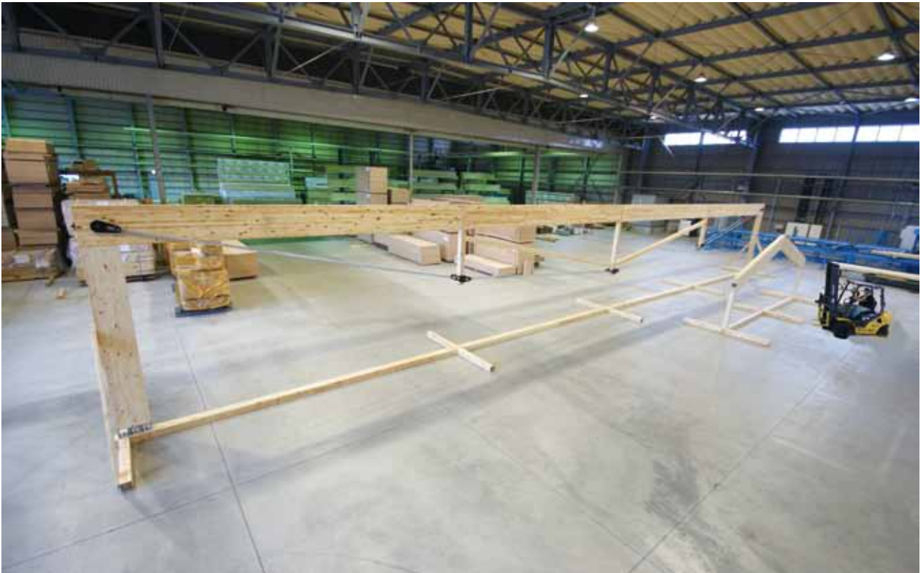
(株)大三商行の東金プレカット工場内に展示された 22 m の実大トラス。写真右側の小さいトラスは組立実演をおこなった 6 m の山型トラス