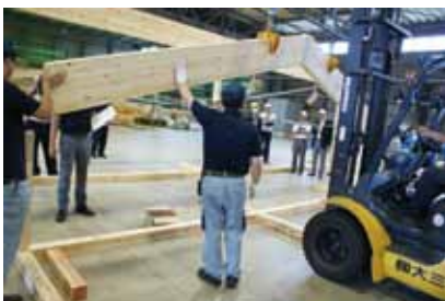
④ ハイブリッドトラスを持ち上げる