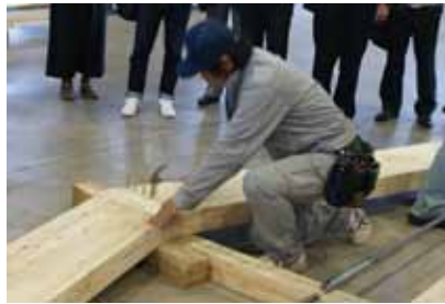
② 小屋束をドリフトピンで固定する