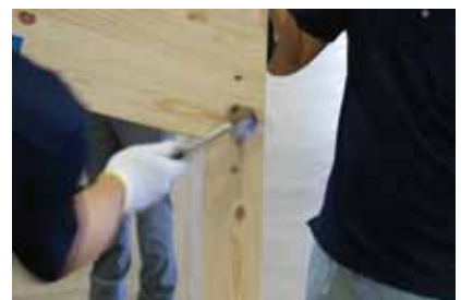
⑥ ドリフトピンで登り梁と柱を固定