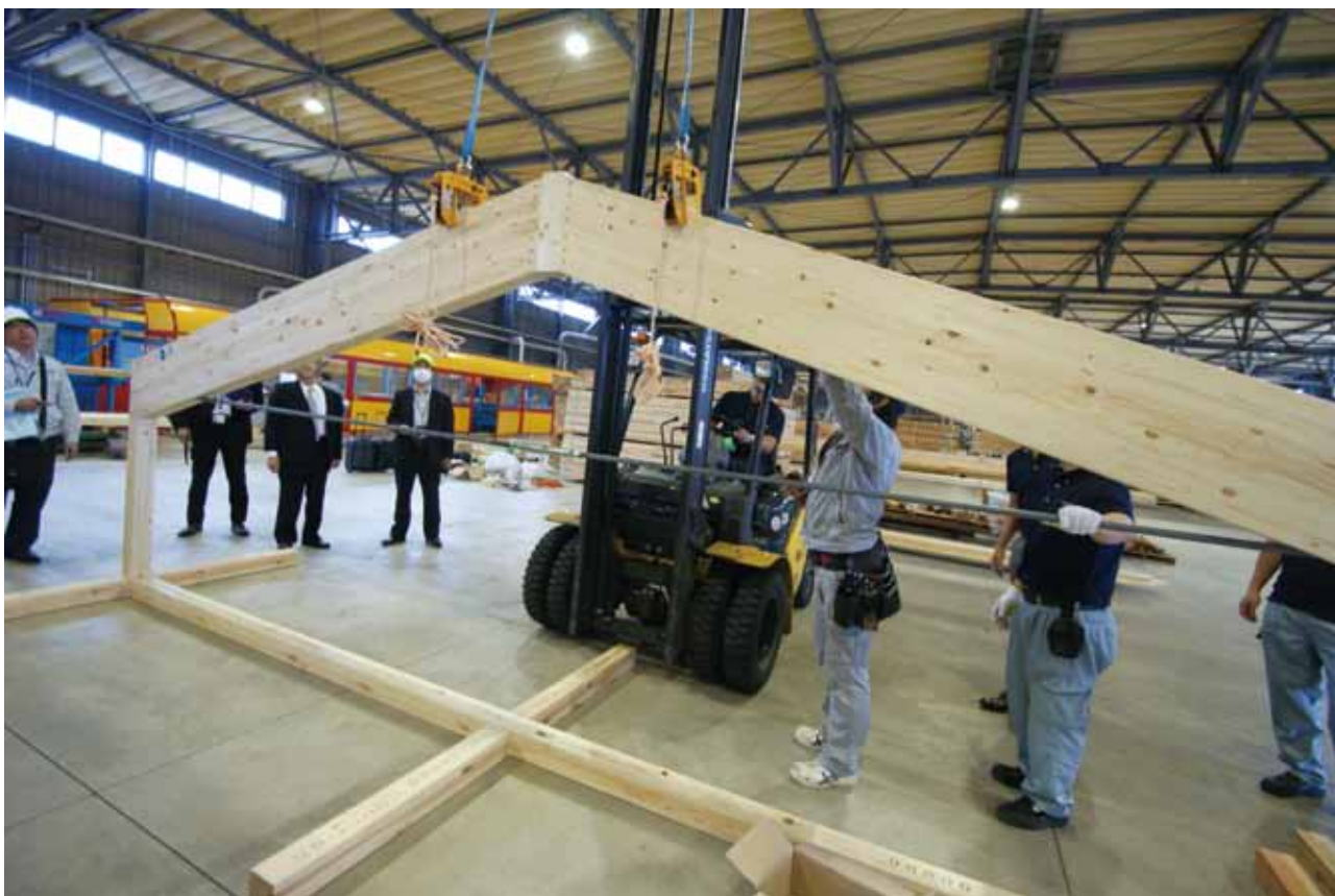
大三商行の東金プレカット工場（千葉県）にて6mの山型トラスの組立実演をおこなった。