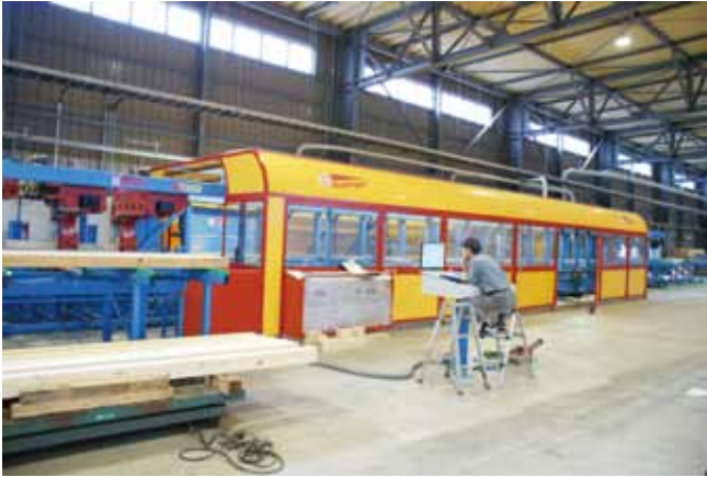
木造建築の複雑な加工に対応する特殊加工機 フンデガーK 2 i 梁せい1250 mmまで対応